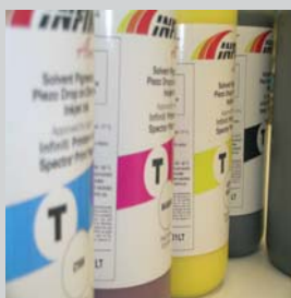
TINTA NFINITI TINU CMYK