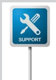
SOPORTE TECNICO 24 / 7