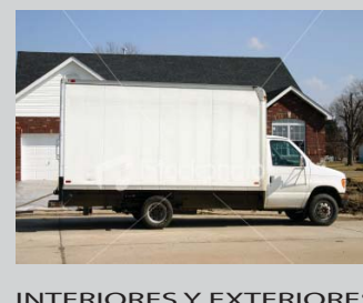
INTERIORES Y EXTERIORES